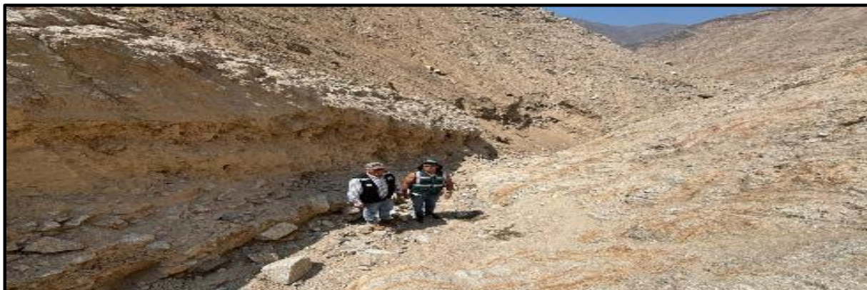
Foto N° 01: Parte inicial de la quebrada donde se necesita hacer la limpieza de cauce