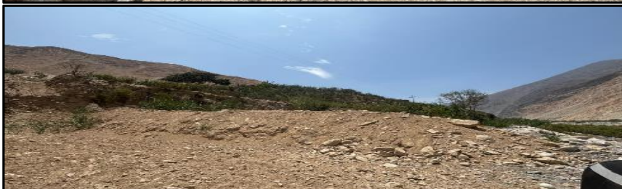
Foto N° 02: Tramo de la quebrada donde se necesita hacer la limpieza de cauce