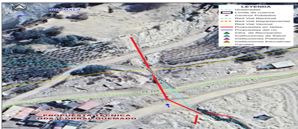
5.- IMAGEN SATELITAL DE ZONA VULNERABLE(GOOGLE EARTH)